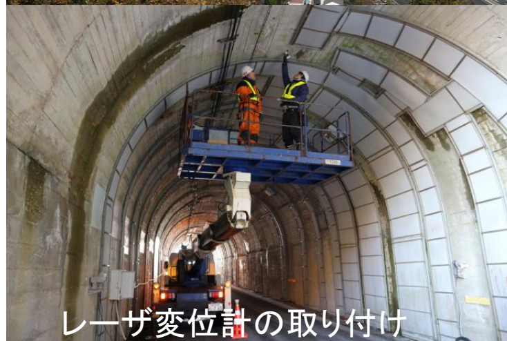
レーザ変位計の取り付け