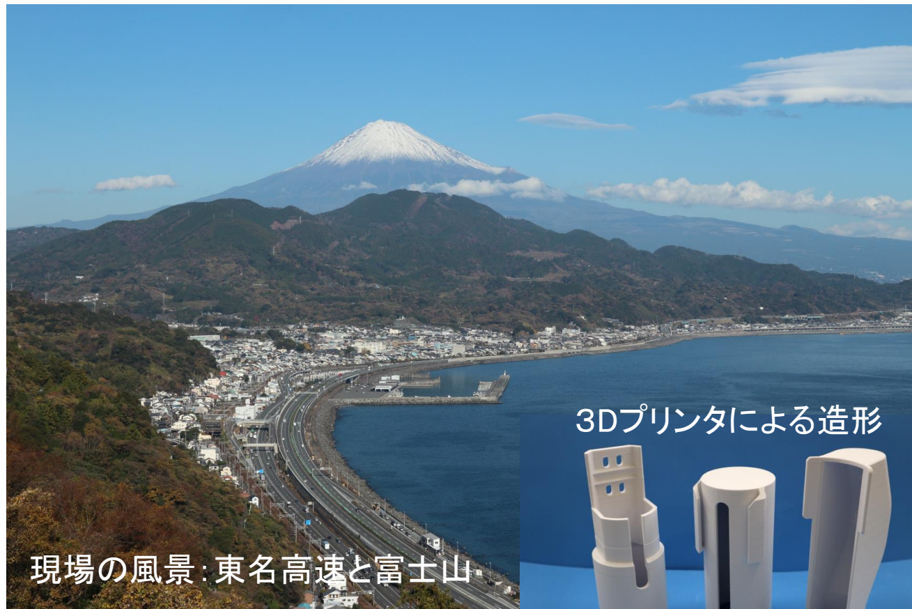
現場の風景: 東名高速と富士山