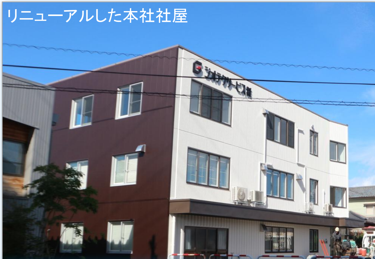
リニューアルした本社社屋

阿賀野Lab: 〒959-2011 新潟県阿賀野市千原245-1 (う木) TEL 0250-47-4142 FAX 0250-47-4143