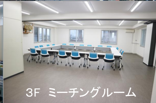
3F ミーティングルーム