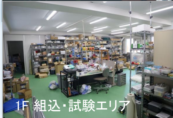
1F 組込・試験エリア